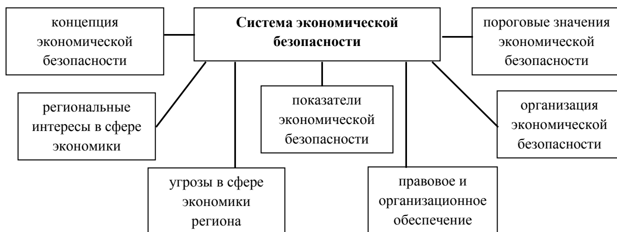
Рис.1 Формирование системы экономической безопасности региона

Система экономической безопасности с точки зрения Бондарской Татьяны Анатольевны включает в себя: организационные структуры, как системы органов законодательной, исполнительной и судебной властей, общественных и иных организаций; нормативно–правовой базы, регламентирующей отношения в сфере экономической безопасности региона; приоритетных направлений обеспечения экономической безопасности региона с учетом общих направлений долгосрочного социально–экономического развития и национальной безопасности РФ в сфере экономики; внутренних угроз в сфере экономики, влияющих на уровень жизни населения; системы мониторинга состояния экономики в целях выявления и прогнозирования угроз экономической безопасности; инструментов оценки уровня безопасности региона, через показатели экономической безопасности, их пороговых значений; совокупности организационных, правовых и экономических мер по предотвращению угроз, обеспечению экономической безопасности 32 . Формирование системы экономической безопасности региона включает в себя семь блоков (рис.1).